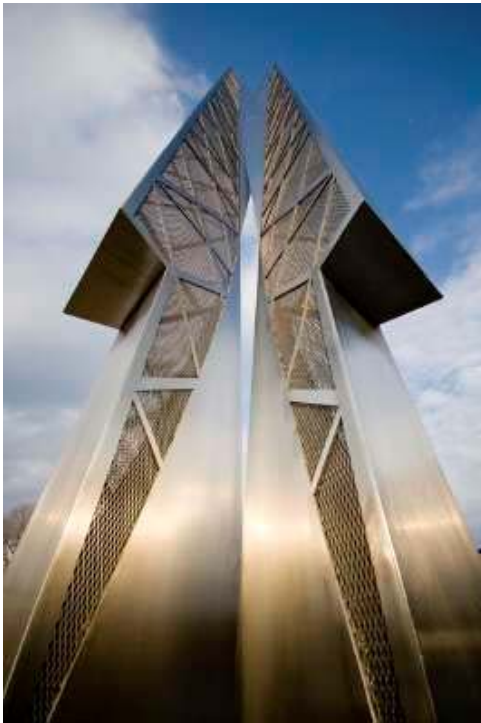
L'homme est un roseau pensant n° 3 , par Jacek Jarnuszkiewicz. 24 avril 2007